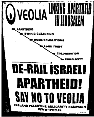
فيوليا تربط المستعمرات بالقدس، فلماذا تكسب عقد ربط مكّة بالمدينة؟!

* إسرائيل صارت تصف حملة م. س. ع بـ «الخطر الوجودي»، فهل أدّى ذلك إلى تغيير في طريقة تعامل السلطات الإسرائيليّة مع الناشطين الفلسطينيين في الحملة؟ وهل تخشى أنت شخصياً على حياتك في ظلّ التهديدات المتصاعدة للناشطين في مجال المقاطعة؟ وهل هناك من خطة لتجاوز الخطط الإسرائيليّة الموجهة ضدّ الحملة؟