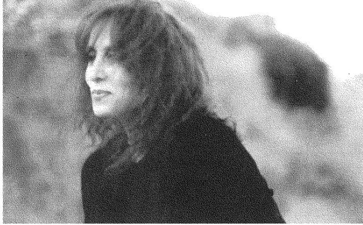
كيفك إنت؟ (١٩٩١): فيروز مع زياد.

٧ - استكملتُ عمليّة استنفار العناصر والمكونات والمفردات بترميز يعود إلى الرؤية الشعرية لهذا العالم. وجاء ينتشل عالم القرية من أسر زمنيّتها، ليقدمها صورةً حلميةً لفرديوس مفقود، أو يوتوبيا وئام مرتجى. وهي صورةٌ لا تَبْرأ من الميتافيزيقيّ الخارق والمسحة الخرافية، اللذين يولدان الروح الرومنسية في الأعمال الرحبانية.