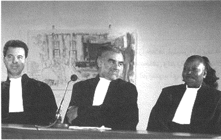
بعد رحيل ميليس وفريقه، عاد براميرتز إلى المحكمة الجنائية الدولية في تعيينات الموظفين الجدد (براميرتز مع أوكامبو وبنسودا)

التقرير الثالث بالتشديد على المعايير الدولية والمهنية والقانونية في شتى جوانب عمل اللجنة، دون أن يدل على مخالفات بعض أعمال اللجنة التي رُئسها ميليس.