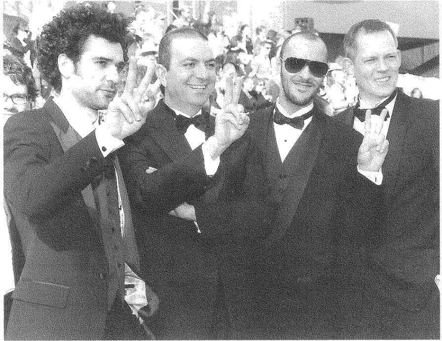
إذا نجح الفيلم في فتح نقاشٍ وطرح أسئلة، فيمكن القول إنه فيلم ناجح

- علمُ إسرائيل عند البعض كان يُرفع للتمويه فقط. طبعاً، البعض قَبِل وجودَ إسرائيل كدولة لليهود، وقَبِل وجودنا فيها كأقلية. ذهبتُ مراتٍ عدةً لاجتماعات الحزب. لم تلائمني. أنا لم أُنتم أبداً إلى الحزب، ولم أشارك في حياتي في عملية التصويت. أنا لا أُنتمي إلى أيّ حزب - أُنتمي إلى فلسطين. أرفض رفع العلم الإسرائيلي ولو من أجل التمويه. أنا فلسطيني، وعندما أُدخل إلى الولايات المتحدة أُعَبئ في بطاقة الدخول اسمَ فلسطين تغييراً اسمها لا يغيّرُها بالنسبة إليّ.