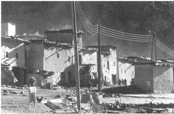
قرية في جبال الأطلس في المغرب، حيث لا كهرباء دائمة ولا ماء جارٍ دائم

وعندما ندعو إلى إعادة الاعتبار إلى الهوية الوطنية الأمازيغية للشعب المغربي، فإن ذلك لا يعني أننا نعادي اللغة والثقافة العريبتين، بل نحن نناضل ضد إقصاء البعد الوطني والحضاري للغة والثقافة الوطنيتين الحقيقيتين في المغرب. كما أننا نناضل من أجل إقرار اللغة الأمازيغية في المجال التعليمي والتربوي من منطلق تعليمها والتعلم بها؛ إذ لا يكفي أن نتعامل معها كأية لغة أجنبية نريد أن نتعرف عليها من باب الفضول المعرفي لا غير، وإنما الواجب الحضاري يُفرض علينا التعامل معها كموضوع للتدريس ووسيلة له، بناءً على قاعدة تقاسم الأدوار بين اللغات المتعددة في المغرب.