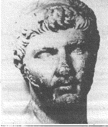
الملك پتولومي، ملك المغرب (٢٤ - ٤٠ ق.م.)

حكاية ذلك الصبي الذي صار من كبار العلماء، ولما مات وذهب في رحلة إلى الجنة بحث عن أبويه فلم يجدهما، وحين سأل عنهما قيل له ربما يكونان في عالم الجحيم. فلما رحل إلى هذا العالم وجد والديه بالفعل، فسألهما عن الذنب الذي اقترفاه حتى عوقبا بالنار، فقالا له: «عندما كنت صغيراً لم نجد ما نطعمك به، وكان العام عام مجاعة، فإذا بضيف حل بنا، فقتلناه وأخذنا ما معه من المال، فربيتناك وعلمناك به!»