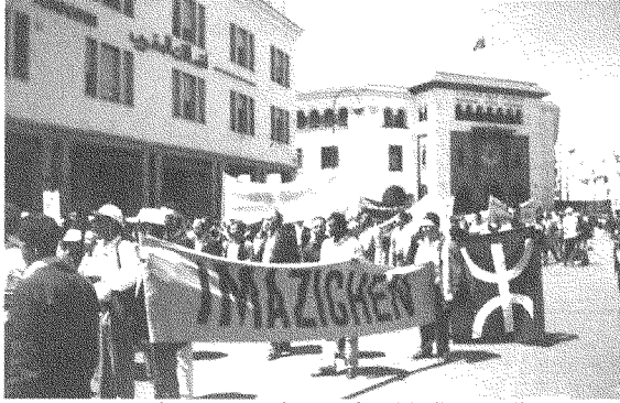
تظاهرة في الرباط، ١ أيار، من أجل الحقوق الأمازيغية

ذاك فلنتحمل كلَّ المسؤوليات التاريخية عمَّا سنجنه على شعوبنا من تدمير حضاري ومن مسخ للشخصية الحضارية. وأشدُّ ما نخافه هو أن تكون الغاية من الحضور السرطاني لفرنسا (بأجهزتها الضخمة) في موضوع الأمازيغية هي جعل القضية الأمازيغية خصمًا عنيداً للبعد الحضاري العربي الإسلامي للمغرب. وإلا فكيف نفسر هذا التنازح الحاد بين عبد السلام ياسين والأستاذ محمد عصيدي؟ إنَّ الدخول في مثل هذا النوع من الصراع من شأنه أن يضئ علينا الوقت والفُرص. إشكاليتنا، نحن المغاربة اليوم، ليست التمزيع ولا التعريب، لأننا نعلم أنَّ المستفيد الأول هي اللغة الفرنسية. وإنما إشكاليتنا هي التمير على الديمقراطية وعلى بناء ديمقراطي يجب على كل حاجات الإنسان المغربي، وهو الكفيل وحده بحلِّ خلافاتنا.