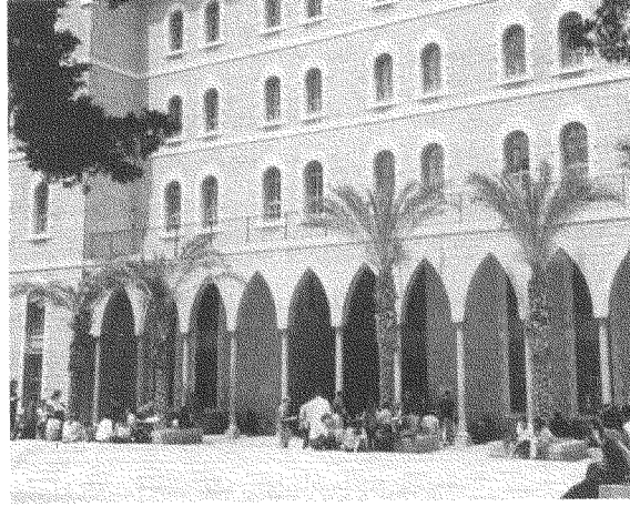
يعترف شرابي بأن الجامعة الأميركية في بيروت لم تعلمه المنهجية ولا البحث بالمعنى الصحيح

على مستوى واحد (ص ٤٢)، وساد عنده وعند زملائه الطابع الإنشائي الأدبي، وكراهية الأرقام والإحصاءات، حتى إنه كان لا يفهم معنى مصطلحات أساسية تُعدّ بديهية في الأبحاث العلمية (ص ٤٣). صحيح أنه حاول طويلاً أن يتحرّر من هذا النمط الذي زرعه الجامعة، «غير أن العملية استغرقت وقتاً طويلاً قبل أن تكتمل» (ص ٤٤). والمؤسف أنه لم