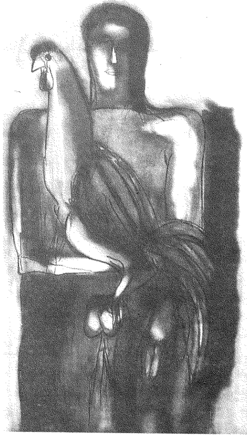
اسماعيل فتاح بدون عنوان، ١٩٩٩

وهو ما بيّنته الفنّانة العراقية هني مال الله (١) وقد تمّ ذلك في حقبةٍ جعلت فيها العولمة، وكذلك الاهتمامُ المتزايدُ بثقافات «الأخرين»، دخولَ الفنانين غير الأوروبيين إلى الأسواق الغربية أقلَّ صعوبةً، على ما تُظهر المعارضُ الكثيرةُ المنظّمةُ حول فنون بلدان الجنوبِ واتّضحتُ حالةُ «الاكتفاء الذاتي القسري» التي فُرِضتُ على الفنّ العراقيّ في عددٍ من الأعمال التي عُرضتُ في باريس عام ٢٠٠٠ (٢) . فعند التجوّل في المعرض، الذي ضمَّ أعمالَ بعض المَع الرِسمائين العراقيين في السنوات الأخيرة، على غرار إسماعيل فتاح أو عادل كامل أو علاء بشير، كان من الصعب تفادي الشعور بأنّ الإنتاج العراقيّ بقي مسمُومًا في الحالة التي كان عليها منذ عقدٍ سابقٍ ولم يتبع التطوّرات التي شهدتها المنطقة وبقية العالم (راجع الصورة هنا).