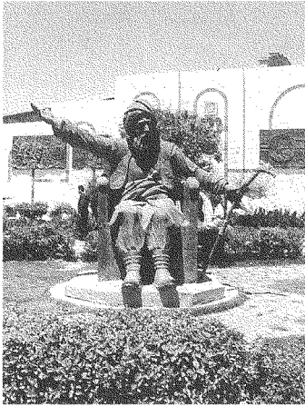
محمود الحفيد، قائد الثورة الكردية في أوائل العشرينيات وأمير ولاية السليمانية

١٨٩٨. كما ظهر العديد من المطبوعات التي تدعو إلى التضامن بين الحركتين الكردية والعربية. وقد ساهم من الجانب اللبناني، مثلاً، نجيب عازوري الذي دعا في كتاباته إلى تحالف العرب والأكراد أمام الخطر العثماني. ومن جهة ثانية، لم يكن تعاطف الكرد مع نضال العرب، كما يقول الدكتور م. س لازاريف، أفلاطونيًا، بل سرعان ما انتقل التأييد الكردي إلى الثوار اليمنيين، وبوشر بجمع الأموال لمساندة قضيتهم.