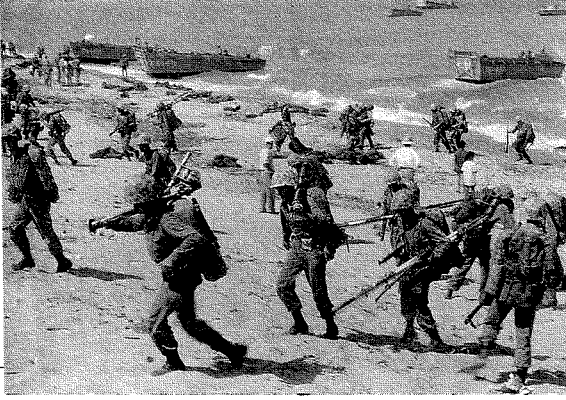
انطبعت في ذاكرة السوريين صورة سلبية عن شمعون وشركائه الذين استقدموا الأسطول السادس في مواجهة الوحدة (المارينز في خلد عام ١٩٥٨)

قاد البعث ٨ آذار، يعاضده الناصريون. ثم افترق الإخوة الأعداء، وانقسمت الحياة السياسية السورية مجدداً على الموقف من الوحدة وعبد الناصر: فاستقوى البعث بالجيش، والناصريون بالشارع. وظلّ هذا الاستقطاب يحكم الحياة السياسية السورية إلى حد كبير حتى غياب عبد الناصر، ومن ثم غياب راهنية الوحدة مع مصر. في هذا المناخ الذي سقطت فيه مصداقية النخب القديمة شعبياً، سيطرت الثقافة التقدمية لتلك النخب التي برزت بعد عام ١٩٦٣ واستنقت نموذجها من أبطال العقب الحديدية والألم ودروب الآلام، بوجهها المتصلبة وجملها القاطعة ويقينها الثابت بدورها وبطلانيتها. وتغذت هذه النخب - بعثية أو ناصرية أو ماركسية - بموقف سلبي واحد تجاه الحياة البرلمانية، التي اقترنت لديها بالحياة البرجوازية. وهكذا صارت «الثورة» أو «الديمقراطية الشعبية» أو «سلطة الشعب العامل» مفردات القاموس المشترك للنخب الجديدة، التي تضاوت لديها قيمة الديمقراطية اللبنانية بعد أن اقترنت بسلطة التجار والإمبريالية؛ ولكن بعض أفراد هذه النخب الجديدة، ولاسيما في صفوف المعارضة، تعامل بطريقة برجماتية مع تلك الديمقراطية التي توفّرها بيروت للزائر والمقيم واللاجئ: فقد نظر المضطهدون إليها كملجأ؛ وأمّا النخب البرجوازية الليبرالية فرأت فيها حلمها الذي ضاع - أو ضيعته - في دمشق، فأقامت فيها روحاً وأحياناً جسداً.