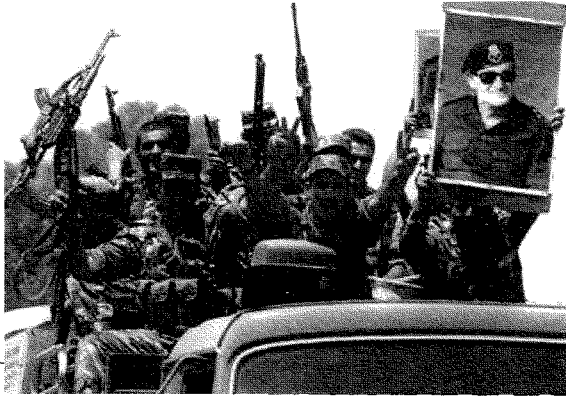
المتقنون السوريون أُصدروا بيانًا يحتجّ على الدخول السوريّ إلى لبنان عام ١٩٧٦، وولّد حزبان على خلفية هذا الدخول

واعتبر إيقاف الحرب على قاعدة الحفاظ على وحدة الكيان اللبناني من المهام الأولى لكلّ ديمقراطيّ علمانيّ وقوميّ عربيّ. (٣) كما أدرك حجم الخسارة التي ستصيب الحياة العربية إن فقدت نافذة الحرية في بيروت. وعبر عن شعوره أمام فاجعة الحرب الأهلية بقوله: «أحسست، أنا ذا الهوى القوميّ العربيّ، أنه ليس وطني فقط الذي يحترق، بل بيتي أيضًا، وأن فاجعة لبنان كانت مجانيةً. فكثيرة هي الأسباب الأصلية والمباشرة التي دفعت إلى إحراق لبنان، لكنّ يخيّل إليّ أنه لقي هذا المصير لأن نافذة للديمقراطية - مهما بدت مثلومة - جعلت من لبنان مختبرًا فكريًا للوطن العربيّ، ومن بيروت عاصمته الثقافية والسياسية...» (٤)