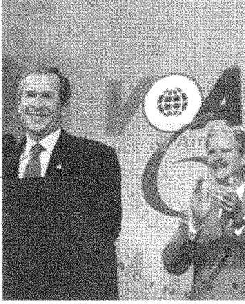
جون تايلور نائب رئيس وزارة المالية الأميركية دعا الشركات الإسرائيلية إلى العمل في العراق، والإعلام العراقيّ اليوم في يد منظرٍ محافظ مؤيد للحرب هو روبرت رايلي (إلى اليسار مع بوش)