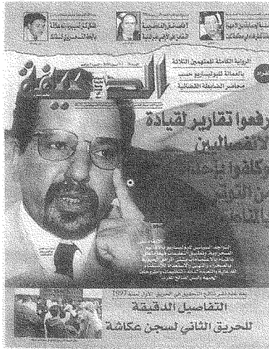
الصحيفة صورتُ بسبب عدد سابق عن موضوع الصحراء!

كان سبب منع العدد ١٤٥ من أسبوعية لوجورنال، الصادر يوم الاثنين ٢٥ نوفمبر ٢٠٠٠، نشرها لرسالة المناضل اليساري محمد البصري الملقب بـ «الفقيه»، والتي كان قد حررها سنة ١٩٧٤، أي بعد سنتين من الانقلاب الفاشل الذي قاده الجنرال أوفقيير ضد الحسن الثاني سنة ١٩٧٢. وتتهم الرسالة، التي كان قد سلّمها الفقيه البصري في إقامته في الجزائر آنذاك إلى مناضل اتحادي ليسلمها بدوره إلى عبد الرحمن اليوسفي في إقامته بفرنسا، اليسار المغربي بضلوعه في محاولة الانقلاب - ومنهم المرحوم عبد الرحيم بوعبيد الكاتب العام السابق للاتحاد