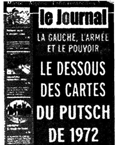
Le Journal. مُنعت هذه المجلة عام ٢٠٠٠ بحجة «استجواب» مع رئيس البوليساريو