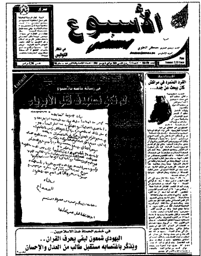
الأسبوع السياسي: اعتقل مديرها في يونيو ٢٠٠٣. لنشره رسالة «الصاعقة»

الدولة اليوم تدّعم «الصحافة الحزبية» فقط بعدما تأكدت من أن المال إذا نَحَلَ السياسة يُمكنه أن يَكيف مواقفها حسب رغبات وتوجّهات الجهة المانحة. وإذا كانت الدولة تُقصد من دعمها تطوير الأداء المهني للصحافة والرقى بها لتؤدي الدور المنوط بها، فلماذا لا تدّعم الصحافة المستقلة؟ ولماذا لا توجه المستثمرين إلى المساهمة فيها كما تفعل مع الصحافة الحزبية؟ سؤال على الدولة أن تجيب عنه إن كانت بالفعل منشغلة بالانتقال بالبلاد إلى مرحلة جديدة.