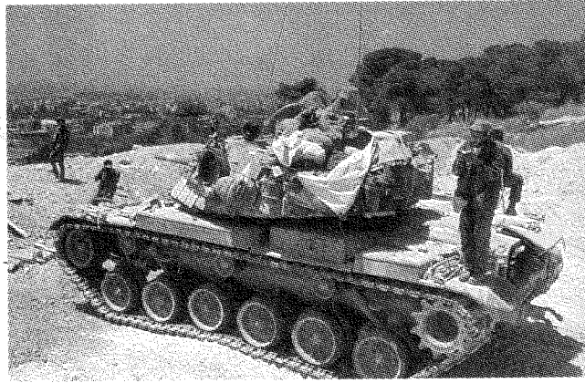
الإسرائيليون في بعبداء، ١٩٨٢

فقدان الذاكرة باسم «الوحدة الوطنية» فادحُ الخطأ، لاعتبارين اثنين: أننا لم نَفقد الذاكرة أولاً، وليس ثمة من وحدة وطنية تَجْمعنا ثانياً! ولكن ما نملكه حقاً هو الخيار، خيارٌ يتعلّق بكيفية فهمنا لماضينا المقسوم وبكيفية إحياء ذكراه. وهذا الخيار، الذي ينبغي أن يكون متجذراً في الماضي، سيُسمع لنا بمواجهة ذكريات هذا الماضي والنجاة منها، أو قد يدفعنا إلى الاكتئاب ويجرّنا - بشكلٍ محتوم - إلى تكرار هذا الماضي. إننا أمام خيارٍ أولٍ يُسمح لماضينا بأن يُملّي علينا مستقبلنا ويضيقه. وهذا الخيار، في رأيي، هو ما تُقدّمه النظرة الطائفية إلى حربي ١٨٦٠ و١٩٧٥، لأنها تُصرّ على الطبيعة الثابتة والمتأصلة لاختلافات اللبنانيين واحدهم عن الآخر، ولأنها تُؤمن باستحالة قيام الوحدة الوطنية. وأمامنا خيارٌ ثانٍ هو استخدامُ ماضينا من أجل توسيع مستقبلنا. واعتقد أن هذا الخيار الأخير هو ما يُبشّر به التأويلُ العثماني [الدنيوي] لأنه يشدّد على أن اختلافاتنا مُشروطةٌ بالظروف وبالأحداث التاريخية، ولأنه يؤمن بإمكانية الوحدة الوطنية. أما ما لا نملكه فهو اللأخيارُ على الإطلاق، وهذا هو ما تسعى الحكومات اللبنانية المتعاقبة إلى أن تدفعنا إليه!