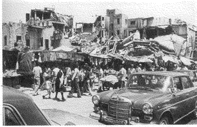
الحياة بين الأتقاض، ١٩٧٨

إمكانية قيام سياساتٍ لاطائفية، وقاعدةٍ لاطائفيةٍ للمواطنة. ونتيجة هذا هي الشلل السياسي، إذ لا شيء ينبغي أن يُعمل إن كان يهدد بالزعزعة التوازن الطائفي «التاريخي» أو «التقليدي» المزعوم. وعليه، لا يُمكننا الصديق عن ١٨٦٠ و١٩٧٥؛ ويجب ألا نعطي الفلسطينيين أي حقوق في هذا البلد لأن ذلك سيزعزع التوازن الطائفي؛ ويجب ألا نعطي المرأة حقوقاً مواطنةً مساويةً للرجل لأن ذلك قد يزعزع التوازن الطائفي؛ ويجب أن نواصل تعويق أنفسنا في مجالات الحياة العامة كافةً من أجل دعم نظام طائفي متقلقل بشكل مُرَمَّن وتمييزي بشكلٍ فاضح وغير قادرٍ على إصلاح ذاته!