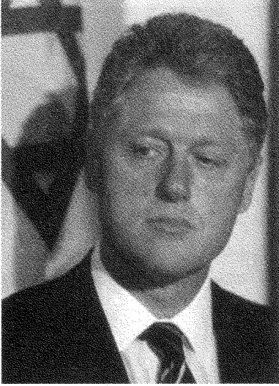
كلينتون حاول أن يقايض «حق العودة» بإعطاء عرفات السيطرة على «الأقصى»

لم يكن لدى الولايات المتحدة إحساساً قاطعاً بأن إسرائيل هي الرصيد الحيوي والأوحد لقوتها في الشرق الأوسط. وكان هذا هو إلى حد كبير إحساس البريطانيين أيضاً. فلقد دَعَمَ البريطانيون إنشاء الدولة اليهودية، ولكن رآوهم الشكوك أحياناً. كان ثمة بالتأكيد انقسامات داخل النخبة البريطانية الحاكمة إزاء مسألة إسرائيل، وبعض البريطانيين اعتقدوا أن هذه المسألة ستزيد من ابتعاد العرب [عن البريطانيين]. وقد تَكَرَّرَتْ هذه الانقسامات بعد ذلك في النخبة الأميركية الحاكمة حين صارت الولايات المتحدة قوةً مهيمنة: فمثلاً لم يكن وزير الخارجية مارشال ميلاً على الإطلاق إلى الدفاع عن إسرائيل ولا إلى تأسيسها. ولم يَدْعُمَ الرئيس ترومان هو الآخر إنشاء إسرائيل، وإن اعتقد أن ذلك الدعم سيفيدهما في كسب أصوات الناخبين اليهود. في الفترة الممتدة بين عامي ١٩٤٨ و ١٩٦٧ ستلاحظ الكثير من المشاعر الأميركية المتضاربة حيال إسرائيل. فإثناء حُكْمَ آيزنهاور كانت المعارضة الأميركية لإسرائيل ربما تفوق التأييد لها. ومع ذلك كانت هناك صراعات مختلفة على مياه المنطقة، وقد دَعَمَ آيزنهاور إسرائيل، وبلغ الأمر ذروته في حرب السويس. ثم بدأت الأمور تتغير في أوائل الستينيات عندما فُقدت الولايات المتحدة الأمل في توجيه قومية عبد الناصر العربية وجهةً «معتدلة»، وازداد عبد الناصر تحالفاً مع الاتحاد السوفياتي، وبدأ يصبح أكثر استقلالاً. وحين جاء كينيدي ازداد تحالف الولايات المتحدة مع إسرائيل، واشتدَّ قوةً أثناء حكم إدارة جونسون*.