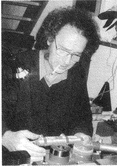
ويلكومرسكي: افتضح أمره، لكنهم لم يسمّوه دجالاً ولا محتالاً!

فيزل لا أهميّة له. ولكن ما يجعله شخصاً لافتاً للانتباه هو كونه تجسيداً لما ألت إليه الهولوكوست [كإيديولوجيا] في الولايات المتحدة، وذلك من حيث: دفاعه غير المشروط عن إسرائيل وعن اليهود، واعتباره كلُّ الأغيار أشراراً وكلُّ اليهود أحياناً. إنّ تجسيداً للهولوكوست إيديولوجياً ومصدر رزق. إنّهُ