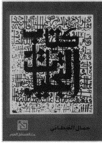
في هذه الرواية يهرب الغيطاني من زمن الخيبة والهزيمة إلى زمن أصل مقدس قديم

زمنًا بعيداً وأن تعود عليه، أو أن تكفني بـ «زمن الروح» المهجورة التي تواجه العالم الموحش بمونولوج لا نهاية له. وتكون الكتابة الروائية، في الحالتين، حديثاً عن «روح مفردة» أي سيرة ذاتية، مقنعة تارة وسافرة الوجه تارة أخرى.