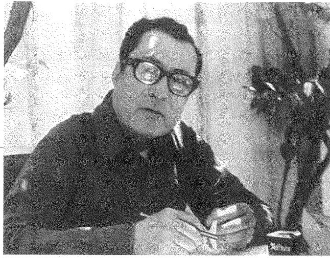
غائب طعمة فرمان: من الزمن الإيجابي القادم إلى إلغاء المستقبل «وجموح الكادحين»

شكلائيّة قوامها الكفر والإيمان. وتَنج عن ذلك منظورٌ دينيٌّ يقول بأحادية القراءة وأحادية التأويل وأحادية المرجع، أي بكلّ ما يَرُفَضُ التَّعدُّدُ والاختلافُ والحوارُ، وكلّ ما يَهْجُو المعاييرَ الحدائيّة: بدءاً بالعقلانيّة والديموقراطيّة والبرلمان، وصولاً إلى الشعرِ الحديثِ والفنِّ والكتابة الروائيّة.