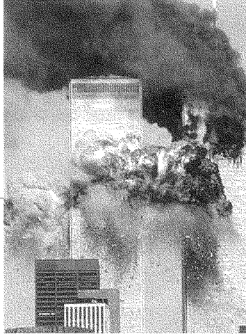
إبداع الخيل العلمي!

العرب والمسلمين). بل إن تلميذاً عراقياً في أحد صفوفني تعرّض للتحقيقات من قبل FBI لأنه يُعرّف قيادة الطائرات. وتلميذ سابق آخر لي تعرّض للتحقيقات لأنه لم يتورّع عن شراء كتب عن الطائرات لشقيقه، وهو طيار في شركة الطيران اليمنية. وهناك طالب سعودي تعرّض للتحقيقات لأن جيرانه قدّموا إخبارية للشرطة بأنه كان يحمل جهازاً مشبوهاً تبين بعد تحرّ وتقص أنه «أركيلة» [نرجيلة]. وإياكم من الأركيلة يا عرب، فهي تثير الرعب في قلوب الأمنيين والأمنات من سكان العالم الراقي.