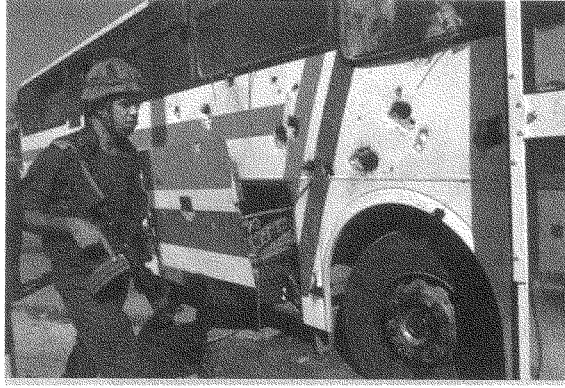
«... الذين يُقصِفون هذه السيارة لا يريدون قتل المستوطنين فيها بل قتل أمنهم: باص مدرسي بين مستوطنين (٢٠ نوفمبر، ٢٠٠٠)»

إنَّ هذا المستوطن الذي نذكره في سؤالكم يحاول أن يتحدث عن المسألة بحسب الإيديولوجيا اليهودية التي تُعتبر كلَّ فلسطين أرضاً يهوديةً. ولكنَّ معظم اليهود المقيمين في أراضي ٤٨ يُعتبرون أنَّ