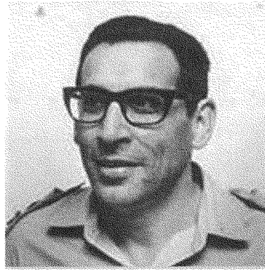
«الشيخ كانوا متبائنا مقاتلين» زنيقي رئيساً للقيادة المركزية في جيش الدفاع عام ١٩٦٨

إن مسألة «العين بالعين» تتصل بالجانب الشخصي. فلو افترضنا أن شخصاً قُتل مدنياً منّا فليس لنا أن نقتل مدنياً لا علاقة له بقتل ذلك المدني. إن عملية العين بالعين هي عملية القصاص. والقصاص يتصل بالجانب الشخصي، لا بما يتجاوز الشخص المجرم. لكن العبارة التي نطق بها الفلسطينيون في سؤالكم تمثل خطأ سياسياً. فقد كان عليهم أن يقولوا: إنهم يقتلون أمننا، فمن حقنا أن نقتل أمنهم. وإذا كانوا يعتقدون أن قتل مدنيينا مبرراً من باب مقتضيات الحرب، فعليهم أن يتعدوا من قتل مدنييهم بحسب مقتضيات الحرب أيضاً. إننا نحارب حرب تحرير، فمن الطبيعي أن حرب التحرير قد تسقط المدنيين من هنا وهناك.