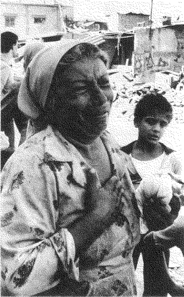
زمن صبرا وشاتيلا هو الذي شهد انخراطي في العمل السياسي

هذان مخيَّمان فلسطينيان قُتِلَ فيهما حوالي ٢٠٠٠ فلسطيني ولبناني على يد القوات الكتائبية حليفة إسرائيل. وفيما بعد وَجَدَتُ لجنة إسرائيلية [لجنة كاهان] الجنرال شارون ضالعا في ما حدث.