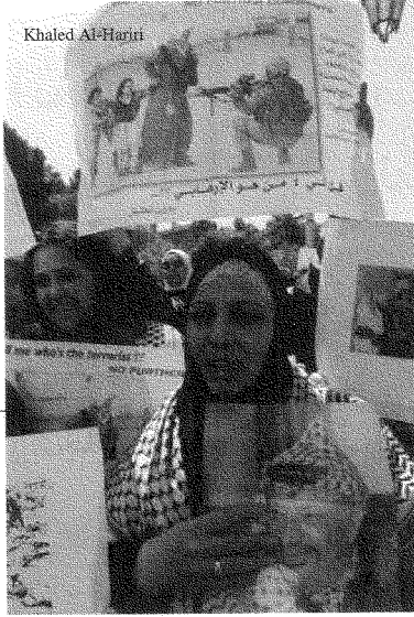
فلسطين أخرجت السافرات والمحجبات في تظاهرة واحدة

الاستخدام الكثيف لكاميرات التصوير والفيديو الشخصية، التي حاولت أن تعوّض عن صمت الإعلام المحلي والخارجي.