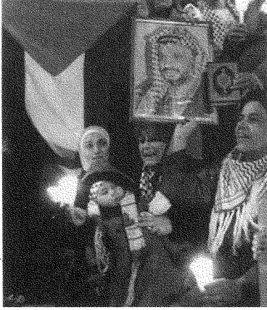
النساء في سوريا: مشاركة نوعية متميزة تستعيد دورهن الوطني والقومي

النسائي) وجابت شوارع مركز المدينة حاملة لافتاتٍ فرديةً تتضامن مع الانتفاضة وتندد بالعدوان. وقد صرّحت إحدى المشاركات بأنّ هذه المسيرة المستقلة تحدث للمرة الأولى في مدينة حمص، وهي تعبّر عن مشاركة نوعية متميزة لما يسمّى بسيدات المجتمع المخلمي، اللواتي تخلّين مع جماهير النساء الأخريات عن التحفّظ النسائي التقليديّ، فنزلن إلى الشارع، مستعيدات دورهنّ الوطنيّ والقوميّ، وذلك بفضل الانتفاضة وتضحيات شعبنا في الأرض المحتلة.