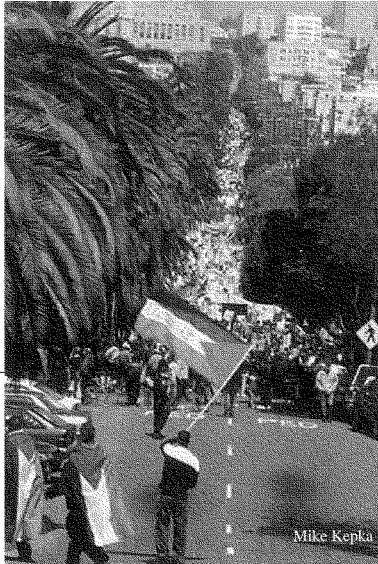
مسيرة سان فرنسيسكو: عشرات الإنبيات ذابت في فسيفساء من ٥٠ الف متظاهر

نُعتَ بالعداء للحركة اليهودية، ومن ثمّ بالعنصرية أو الأصولية أو ما سنتم من نعوت. فذلك سيُحبط أي أمل لدينا في إحداث تغييرٍ شعبيٍّ في الولايات المتحدة.