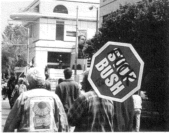
الدال هو أن من يرفع هذه الشعارات اليوم أميركيون بيض

مليئة بخراء بوش)، ناحتاً بذلك بين كلمة Bush (اسم الرئيس) و Bullshit (وهو الهراء، أو خراء الثور بالمعنى الحرفي). وقد وجدت هذه الإشارة دقيقة جداً في وصفها لما تغطيه وسائل الإعلام الأميركية، لأن ما تغطيه هو حقاً خراء أطلقه بوش! إشارة أخرى تقول: «اقرأوا كُتُب إسرائيل شاحاك» (وهو الكاتب الإسرائيلي الراحل الذي فضح الممارسات الإسرائيلية العنصرية، وجذور العنصرية في الصهيونية، بل وفي اليهودية أيضاً). وحملت مجموعة من الأفارقة الأميركيين إشارة كُتِب عليها: «خمسون عاماً تكفي، يا شارون. دَع اللاجئين الفلسطينيين يعودون إلى بيوتهم.» وحمل عمال في قطاع الصحة إشارة كُتِب عليها: «بلايين الدولارات لمحاربة الإيدز، لا لدعم الأبارتايد الإسرائيلي!»