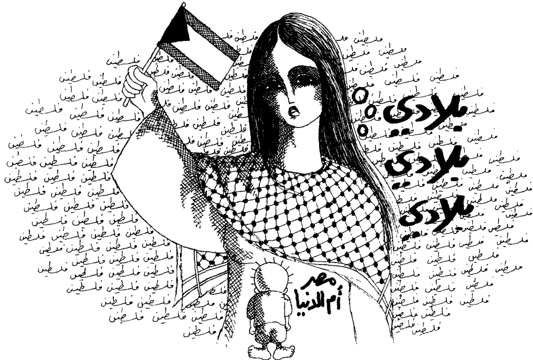
كان ناجي وكثيرون - ومنهم أنا - ضد كامب دايفيد، لكن ذلك لا يعني أننا ضد مصر!