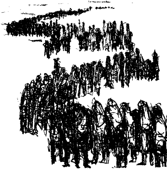
من «البوم من وحي النزوح» للفنان الفلسطيني عبد عابدي

من أجل قمع المقاومة الفلسطينية حتّى مسؤولٍ إسرائيليٍّ رفيعٍ في أوائل عام ٢٠٠٢ الجيش الإسرائيلي على «تخليد الدروس واستدخالها حول الكيفية التي قاتل فيها الجيش الألماني في غيتو وارسو». ويبدو أنّ الجيش الإسرائيلي قد اتّبع نصيحة ذلك المسؤول، بالنظر إلى المذبحة الإسرائيلية في الضفة الغربية والتي بلغت أوجها في عملية «الدرع الواقية»: من استهداف سيارات الإسعاف الفلسطينية والطواقم الطبية، إلى استهداف الصحفيين، وقتل الأطفال الفلسطينيين «للتسوية» (على نحو ما ذكر كريس هُدْجِر، الرئيس السابق لمكتب نيويورك تايمز في القاهرة)، وتجميع الذُكُور الفلسطينيين الذين تتراوح أعمارهم بين ١٥ و ٥٠ سنة وتقييد أيديهم وتكميم عيونهم ووضع أرقام لهم على معاصمهم، وتعذيب المعتقلين الفلسطينيين دونما تمييز، وحرمان المدنيين الفلسطينيين من الطعام والماء والكهرباء والمعونات الطبية، وشنّ الهجمات الجوية العشوائية على الأحياء الفلسطينية، واستخدام المدنيين الفلسطينيين دروعاً بشرية، وجرف المنازل الفلسطينية بسكّانها المتكوّمين داخلها. (٤٨)