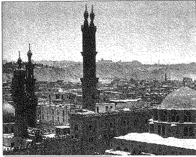
حقّق الأزهر نصرًا كبيرًا حينما حصل على فتوى عام ١٩٤٤ بقصر الجهة الدينية المختصة عليه فقط

دارت قوانينُ الرقابة والقرارات الوزارية المتعلقة بها حول «محتوى» الإبداع، و«شكل» تقديمه، و«الرؤية» التي يَحْمِلُها للمجتمع. وقد بدأت الرقابة على الإبداع الفنيّ مع دخول المسرح كفنّ جديد إلى مصر. فقد اعترض الخديوي إسماعيل عام ١٨٧٠ على مسرحية يعقوب صنوع الضربان، التي قدّمها على مسرح الخديوي الخاص في سراي قصر النيل، لما تتضمّنهُ من تعريض بمن يتزوّج من أكثر من واحدة - ومنهم الخديوي نفسه. فخرج الخديوي من المسرح غاضباً بعد أن أنب يعقوب صنوع «موليير مصر»، فنصحهُ المقرّبون بعدم تقديمها مرّة أخرى. وكانت هذه النصيحة المستمّدة من موقف سلطوي هي أوّلُ توجّه رقابي من أعلى سلطة في البلاد تُرَفِّض عرضاً مسرحياً لأنّ «رؤيته» تخالف رؤى «أولي الأمر». ثم بدأ اهتمامُ السلطة بهذا الفنّ الجديد وما يقدمه من موادٍ وأراء قد تكون مخالفة لما تراه هذه السلطةُ صالحاً للمجتمع بوجه عامّ، ولمصالحها الطبقيّة والفنويّة بوجه خاصّ. لذا حرّص قانونُ المطبوعات المعادي للديمقراطية والصادر في أكتوبر عام ١٨٨١، بعد شهر ونصف الشهر من مظاهرة العسكر بقيادة أحمد عُرابي أمام سراي عابدين، على الإشارة إلى حقّ الحكومة في مصادرة