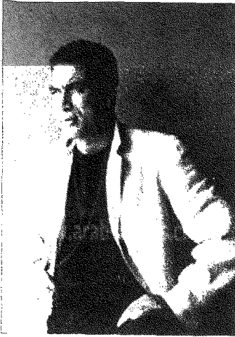
تمزكت الشخصية الرئيسية التي قدمها أحمد زكي في فيلم «البري» على قادة معسكره، فاصرت وزارة الداخلية على حذف نهايته

استنار بالوعي؛ وفي هذا إشارة واضحة إلى ثبات واقع هؤلاء الجنود الفقراء، مادامت قوانين حياتهم لم تتغير بعد.