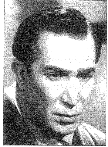
أول تدخل للأزهر وقف ضد فكرة تجسيد يوسف وهبي لشخصية النبي محمد في فيلم تركي - ألماني

عليه أنها الأزهر، الذي حَقَّقَ كمؤسسة دينية نصرًا كبيرًا حينما حصلَ من مجلس الدولة على فتوى عام ١٩٩٤ بقصر الجهة الدينية المختصة على الأزهر فقط.