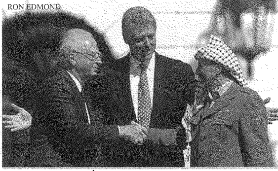
«إنّ فرض الخيار السياسيّ كان إنجازاً حقّقته الانتفاضة...»: المصافحة الشهيرة (١٩٩٣)

إنّ هذا «الجنون المتدرج» قادر على خلق واقع خطير جديد يعيد الاحتلال الإسرائيليّ إلى قلب المدن الفلسطينيّة، ويضع قوات الاحتلال إزاء زخم المواجهة الشعبيّة الواسعة من جديد، بعد أن نجحت إسرائيل في اتفاقات أوسلو بفك الارتباط مع المراكز السكانيّة الفلسطينيّة والإفلات منها. ومثل هذا التطور يضع قواعد جديدةً تحمّل أخطاراً جديدة، ووسائل مواجهة جديدة تمتدّ جذورها إلى آليات الانتفاضة الأولى. وإنّ أحدًا لا يستطيع أن يُنكر على الشعب الفلسطينيّ حقّه في الدفاع عن نفسه، ومقاومة الاحتلال في رام الله، ومخيّم طولكرم، وقصبة نابلس: وإنّ أحدًا لا يستطيع عندها أن يُخطئ في التمييز بين المجرم والضحيّة.