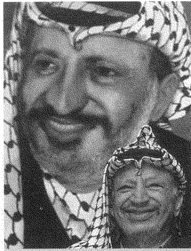
«ردّ زئيفي: لا تخوفوا شعب إسرائيل بمسألة البديل... عن عرفات»: مؤتمر صحفي لعرفات أثناء حصاره

في اعتقادي أنّ كرة الثلج قد بدأت تتدحرج، وأنّ مسألة من سيربح المليون باتت مسألة وقت، وأنّ المراهنة الفلسطينية على هذا الاختراق ستبقى عاملاً حاسماً قادراً في نهاية المطاف على إنجاز عزل سياسة بحر الموت التي يبشّر بها شارون الشعبين الإسرائيلي والفلسطيني والتأسيس للسلام العادل والاستقلال على أنقاض هذه السياسة.