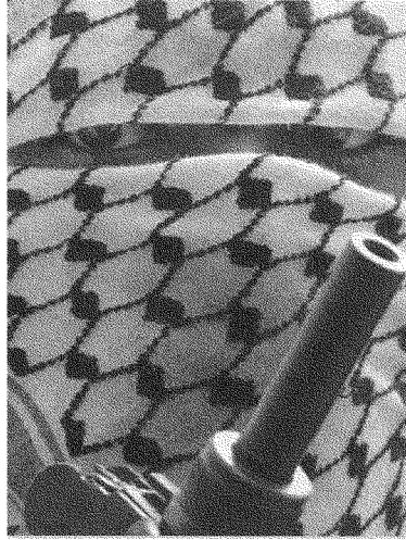
«... عسكرة الانتفاضة.. غير قادرة على

اليهودية في غربي نهر الأردن. ولمواجهة هذا الخطر، لا بسبب الاعتراف بحقوق الشعب الفلسطيني، تُطرح هذه المدرسة تقسيم البلاد وقيام دولة فلسطينية إلى جانب إسرائيل، في مقاس مقترحات كلينتون المعدلة بتحفظات براك. أمّا المدرسة الثانية فهي مدرسة «أرض إسرائيل الكبرى» التي استعادت عافيتها نتيجة للفشل الذي قاد إليه براك، ولإيقاعه بالعملية السياسية التفاوضية وتدميرها والتنازل للمشارك الفلسطيني في الحل السياسي، ويقوم منطق هذه المدرسة على ادعاء قدرتها على التمسك بـ «أرض إسرائيل الكبرى» من جهة، وعلى المحافظة على يهودية الدولة من الجهة الأخرى، وذلك من خلال: