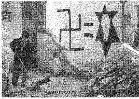
«نقلت الصهيونية فكرة سمو الدم ونقاء السلاح اليهودي عن النازية»: شعار على الحائط بعد التدمير في رفح (٢٠ يناير ٢٠٠٢)

إنّ الهجوم على باص إسرائيلي في المستعمرات، من حيث المبدأ، شرعي من باب الدفاع عن النفس. والقول إنّه قد يكون في الباص مدنيون ردّ عليه في الفقه الدولي سابقاً، في حالات في أوروبا (يوغوسلافيا، حرب التحرير في فرنسا،...) وملخص الرد أنّ على المدنيين الذين يصلون إلى مواقع الحرب ويدركون مخاطرها أن يتخذوا إجراءات لحماية أنفسهم، وإلا فالأفضل ألاّ يأتوا. إنّ هؤلاء المدنيين يتحملون مسؤولية أنفسهم في القدوم إلى المناطق الخطرة.