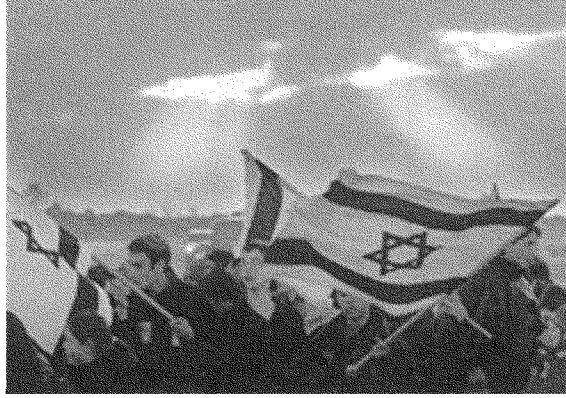
«الحديث عن الدولة الحصرية لا يمكن أن يشكل الحل في المنطقة»: تظاهرة مستوطنين (يناير ٢٠١١)

خطوة كبيرة نحو فكرة الدولة الديمقراطية على كل فلسطين التاريخية، وهي الدولة التي دعت إليها الثورة الفلسطينية. لذلك فإن الحديث عن الدولة الحصرية لا يمكن أن يشكل الحل في المنطقة. وفي المقابل لا يمكن للفلسطينيين أن يبقوا يبيكون من الظلم الصارخ الذي حل بهم. وعليه، فإن تقديم الرؤى الجديدة هو ضرورة لخطوات نحو صيغة أكثر عدالة. والصيغة التي نراها هي الدولة الديمقراطية العلمانية في