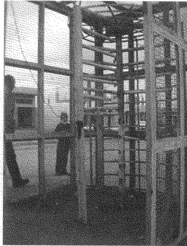
«... بضع بقع بانتوستان بسيادة منقوصة: بوابة الدهيشة»

الأساس في القانون الدولي وفي ميثاق الأمم المتحدة هو منع الحرب. لكن البند رقم ٥١ استثنى حالة واحدة، هي الدفاع المشروع عن النفس. ولذلك حدّد الميثاق ما هو العدوان وشروطه، وحدّد ما هو الدفاع عن النفس وشروطه. الحالة الفلسطينية تُنطبق وفقاً لمعايير القانون الدولي بشكل كامل على الدفاع المشروع عن النفس. فهناك احتلال إسرائيلي (والاحتلال عدوان بالتعريف القانوني). وحقّ الناس في الدفاع عن أنفسهم مشروط بالتالي: (١) عندما يكون هناك تهديد بالعدوان أو الاحتلال يُطلب من المهدّد أن يحاول السعي بالوسائل السليمة لحلّ الخلاف: وهذا ما تجاوزته الحالة