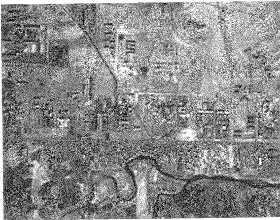
كابول قبيل القصف الأميركي: تصوير «ايكونوس» الذي اشترى... ليستكت!

على المشاهدين الأميركيين أن يمتلكوا حرية أن يقرروا الإجابة بأنفسهم عن هذه الأسئلة!