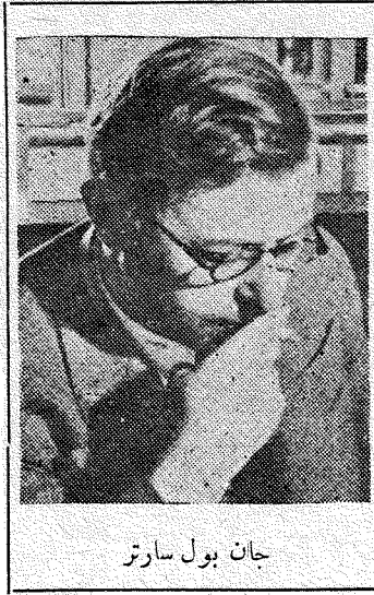
جان بول سارتر

هذه الدعوة الصادقة، مصبوبة في هذه الكلمات الواعية، متجهة الى هذه الأهداف المثالية، جديرة بان يتقبلها الأدباء تقبل الايمان الذي لا يشوبه الشك بان الادب تبعه ومسؤولية: تبعه حين نفهم انه رسالة توجيه ومشعل إصلاح وقيادة رأي ودعوة حرية وكرامة وعدالة... ومسؤولية حين ندرك ان من واجب الموجه والقائد والمصلح ان يكون أميناً في نقل آرائه، حراً في تكوين أفكاره، لأن المطلوب من الأدب كما يقول سارتر ان يخاطب الأحرار وألا يتجه إلى العبيد! عندئذ