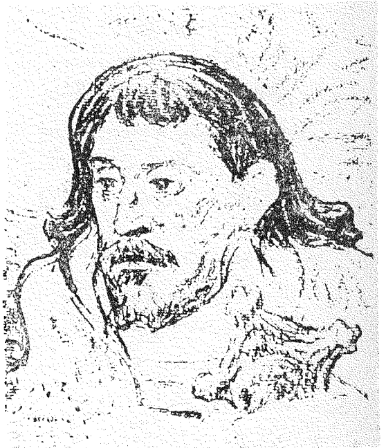
غوغان - بريشة سكانكر

طريقها نحو الانقراض ، ان اخذ بعض الناس يخاطون بين هذه المدارس المختلفة دونما دراية او علم ، وراحوا يتعمنون كل صورة لا يفهمونها بانها رمزية او سريالية . ومرد هذا الخلط كله راجع الى تقدم الفنان على عصره وتجرع القيم التي يتخذها الجمهور اساساً لمقاييسه وهي مقاييس خلفتها عقلية قديمة لا يواكبها عمل عقلية اليوم المتجددة الطموحة . هذا سبب عام واما بالنسبة للشرق العربي فيرجع عدم التفاهم بين الفنان والجمهور الى انعدام الاروقة الدائمة Gallarys التي تضم لوحات فنية تمثل مدارس مختلفة ، ثم قلة المعارض الفردية والجماعية ثم انعدام الصحف والمجلات التي تعنى بشؤون الفن وخصوصاً الفن التشكيلي Plastique كالرسم والنحت و ( العمارة ) وهي التي تعمل على تقريب وجهات النظر المختلفة . ان وجود هذه الاسباب مجتمعة وظهور تجار النقد الذين يلوكون الكلمات والمصطلحات الفنية المختلفة دونما فهم او تحقيق هي التي سببت تشويه الحقائق فنتج من ذلك الخلط بين القيم المختلفة وبالتالي انعدم التفاهم بين الفنان والجمهور !!