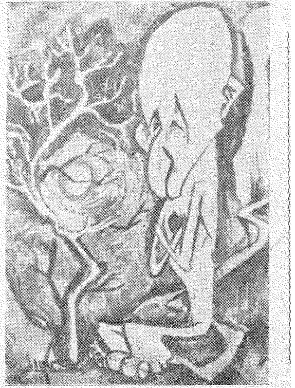
الوحيد في حزنه

الماهق واحلامه . وكانى بالفنان يشبه المراهق بمركبة ذات حصانين ينطلق منها حصان اليسار وهو حصان العواطف والخيالات ، ويتأخر حصان اليمين وهو حصان الفكر والتفكير فيختل توازن حياته .