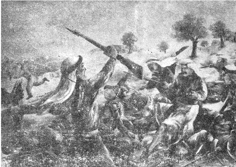
الجائزة الثانية : بطل القسطل ( عبدالقادر الحسيني ) للفنان سهيل عياش -

٤ - ان تفتح الجامعات والمعاهد العربية ابوابها للطلبة الجزائريين دون تقييد بالعدد ، كما يناشد المؤتمر الهيئات العلمية والادبية والعلماء والادباء ودور النشر بان تنبرع بالكتب والمجلات الى المكتبة العامة لوزارة الثقافة للحكومة الجزائرية بالقاهرة « شارع مديرية التحرير جاردن ستي بالقاهرة » .