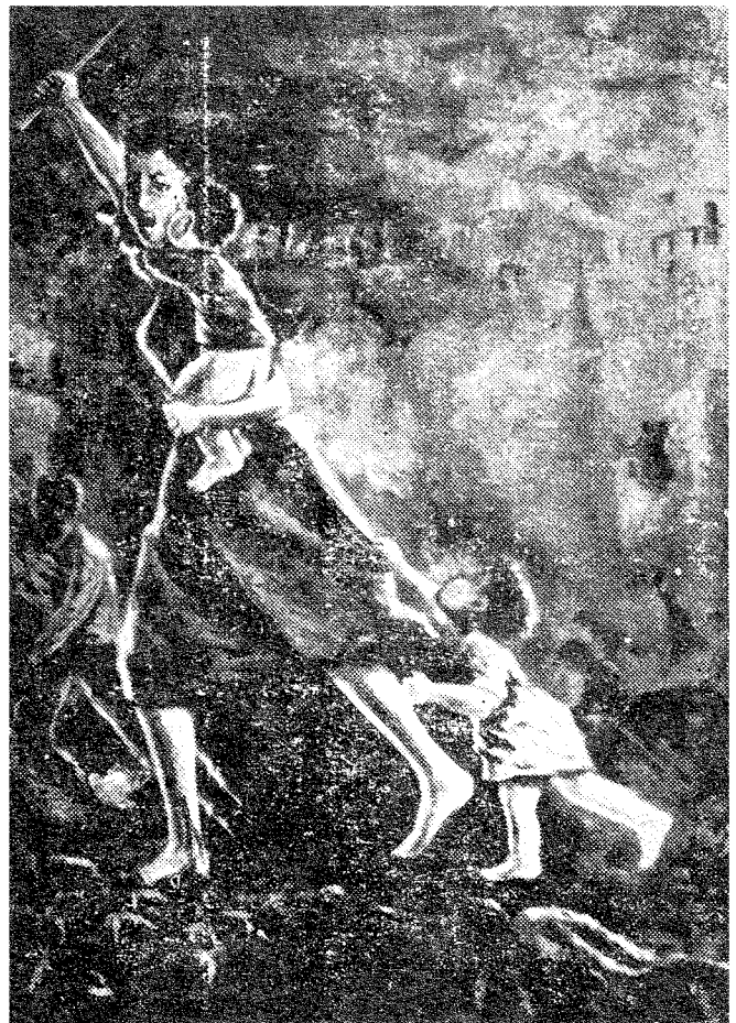
اللوحه الفائزة بالجائزة الاولى الموضوع : كفاح المرأة - للفنان رمزي كيلو

الذي يجعل المرء مسيرا للقبيلة . وقال ان مثل هذا النظام لا يمكن ان يرتبط بالمسلك الانساني .