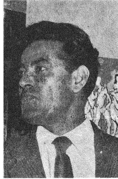
الفنان احمد الادريسي

الاخرى ، فهو لا يستطيع كيفما كانت الظروف ، ان يتحرر من تأثير البيئة التي نشأ فيها ، مهما كانت نوعيته ، وطريقة فنيته الابداعية .