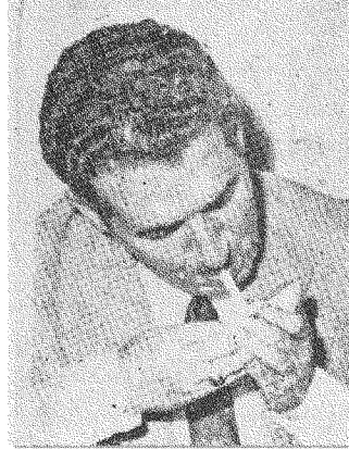
احسان عبد القدوس