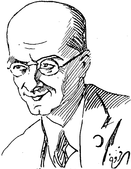
ايلى ابو ماضي