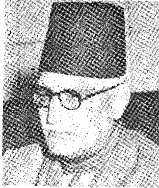
عباس محمود العقاد

والبقاء التفسير والحياة التطلب او ما تبصر الزمان ان اتيلا لا ينضب وهو للعمر مالى وهو للعمر يسكب ويقول في مقدمة قصيدة اخرى عنوانها: نحن والزمن ( ديوانه ٦٤٠ ) « الزمن كما يفهمه الانسان فكرة من افكاره ومقياس من صنعه فهو يقيس باحساسه بامور نفسه وبالمرئيات والمحسوسات وما يعتربها من تحول وفكرة الزمن هذه امر نسبي شأنها شأن الاحساس بالحرارة والبرودة . » ويقول شكري ان الانسان تصور الدهر شيخا هرما وهذا خاتمته اذ عليه ان يتصوره شابا لان الانسان هو الذي