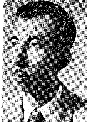
بدر شاكر السياب