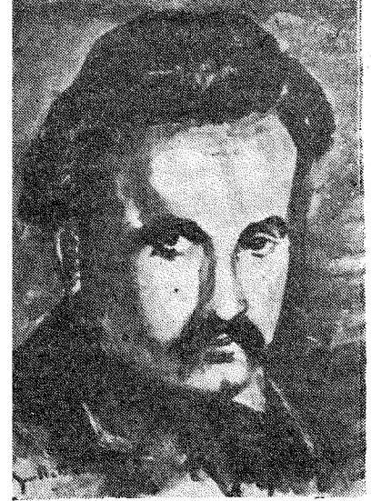
جبران خليل جبران