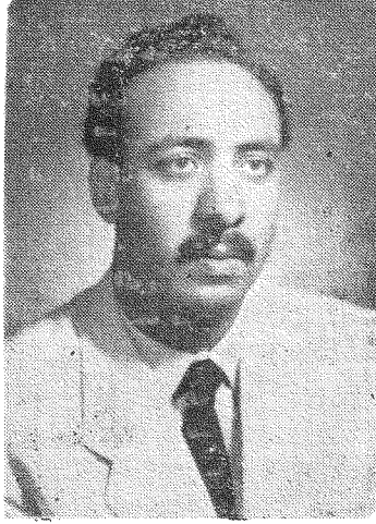
صلاح عبد الصبور

كما يتبدى في صورة الفارس الذي فقد اصلته وصدقه . فهو ما زال يحمل ملامح الفارس ولكنها ملامح كاريكتيرية : متوج الفسودين بالحديد والحصى ، قسمانه تنطق بالزيف ، ولسانه الذرب يجييد الثرثرة ، ونفسه تصح بالانفعالات الرخيصة الشائعة . وامام صورته