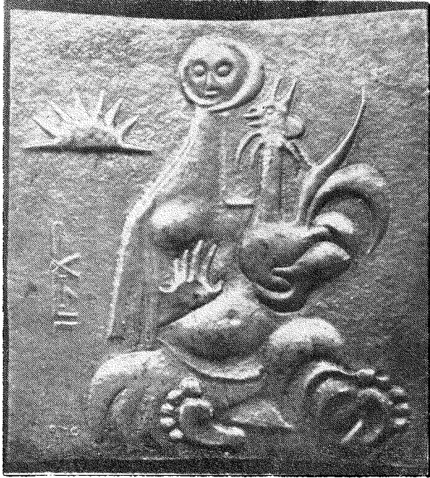
( الفلاحة ) نحاس مطروق لعبد الرحمن الكيلاني