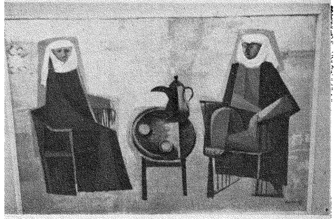
( صديقان ) يوركو لازسكي