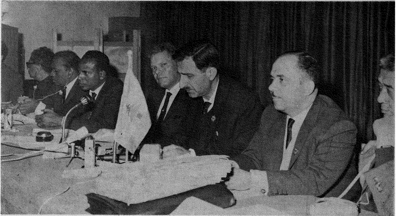
منصة الرئاسة في المؤتمر