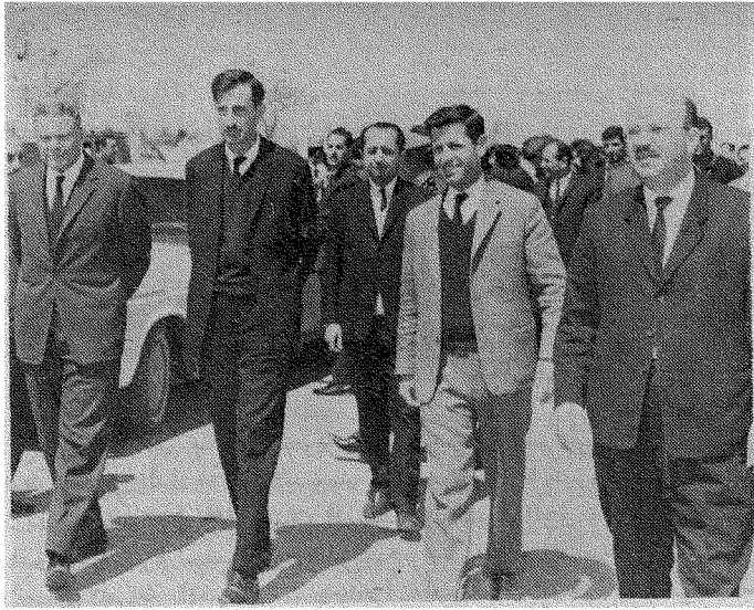
اعضاء الوفود في زيارتهم لدمشق