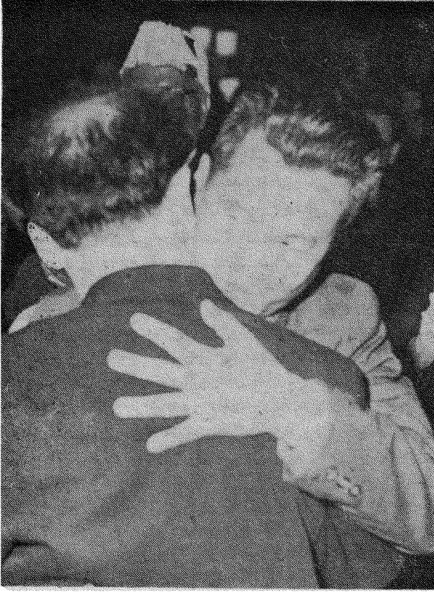
مندوبا فييتنام الشمالية والجنوبية يتعاقبان