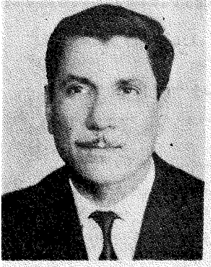
عبد الوهاب البياتي

من العمق والبساطة والشفافية رغم دقة التكنيك البنائي ووضوح العناصر الملحمية والدرامية . والصورة الشعرية في هذه « الحكايات » هي - على حد تعبير الشاعر تريسنان تزارا - « فعل شعري » (٧٤) أكثر منها تشبيها أو تقريبا لمفردات مساعدة . ومن هنا تكتسب تلك « البساطة الاخاذة » التي تعرف بها . في « مصرع الشيخ بدر الدين » وهي ذات بناء ملحمي ، يقدم لنا الشاعر بطولته نثر ومنتصوف تركي استشهد في القرن الرابع عشر . ويستخدم ناظم حكمت في المقاطع الختامية منتهى التركيز والايحاء في رسم مشهد الاستشهاد . فهو يبدأ من الخارج وبدرجة عالية من التكتيف :