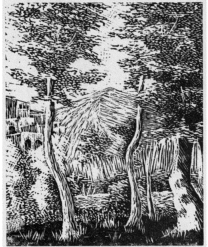
اشجار القرية - من اعمال الحفر للفنان مأمون حمصي

هذه الحقائق جمعتها من استقصائي في اوساط الرسامين والاساتذة في الكلية وعشرات الاحاديث مع من يهتمون باوضاع الوسط الفني