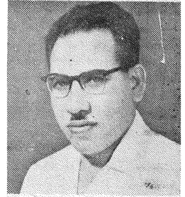
علي احمد باكثير

« والشواف في مسرحيته شاعر هادف . فهو لا يقدم لنا فناً مسرحياً محضاً ، ولا يريد امتاعنا بحكاية من حكايات التاريخ ، كما انه - رغم انسانية قصاياه - لا يطرح قضايا انسانية عامة ، بل يطرح قضايا الخاصة التي تتحرك على تربتنا ، واذا اردنا الدقة فينبغي القول انه يطرح قضايا الكبيرة ، قضايا الاساسية ، ففي « شمسو » مثلاً حاول ان يعث فينا حرصنا على عقيدة التوحيد بنموذج تاريخي ضحى من أجل هذه العقيدة . وفي « الاسوار » طرح قضية فلسطين بكل جوانبها المساوية ووضع ايدنا على اسباب النكسة في وقت عجزت فيه الوسائل الاخرى عن ان تفسح تلك الاسباب بين ايدنا . » ( ١٨ )