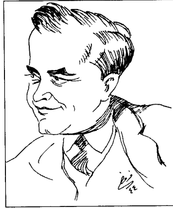
رئيف خوري بريشة مصطفى فروح

ومع ذلك، وبحثاً عن مزيد من الوضوح، فإنه يمكن التوقف قليلاً أمام الدلالة التاريخية لظهور المثقف التنويري العربي ووظيفة الثقافة التي نادى بها ومارسها في أن. فقد رأى المثقف التنويري، على خلاف الكاتب التقني، في الثقافة شأنًا عاماً لا ملكية خاصة، فأعطاه وظيفة اجتماعية، لا بمعنى النبوة والتبشير بل بمعنى التنديد بالظلم والجور والترويع والتجويج. ونقل المثقف التنويري الثقافة من حيز الملكية الخاصة إلى حقل الشأن الاجتماعي العام؛ فجعل النقد، أي البحث عن الأفضل، عنصراً محايثاً لها وداخلياً فيها. فالثقافة، بحسب المثقف التنويري، تنقد قراءة الشعر الخاطئة، والاستغلال الطبقي، وإهانة الأمة، وأشكال الوعي المتخلفة... الأمر الذي يؤكد النقد بديلاً اجتماعياً (حالمًا ربما) بقدر ما يؤكد الدلالة الأخلاقية للثقافة. ولم يكن نفي الثقافة كملكية خاصة إلا نفيًا للفردية الجامحة والأنانية المتوارثة؛ وقد جسّد المثقف التنويري هذا كله حين اندرج في المشاريع الشعبية الاجتماعية والقومية، حيث تتموضع وتتجاوز علاقات النقد